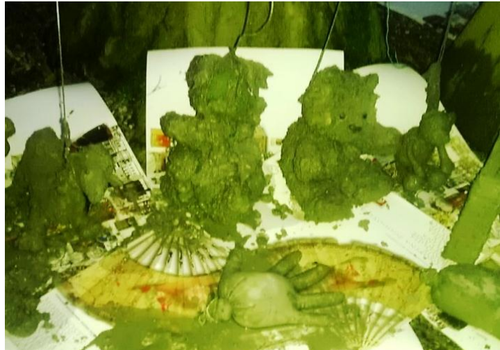
V beton pomočene plišaste živali, ki se sušijo