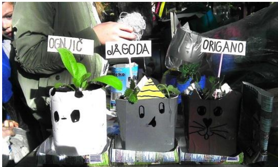
Sodelovanje Ustvarjalnice z Vrtnarskim kotičkom

Zadnji teden v aprilu je potekal v sodelovanju z Vrtnarskim kotičkom, saj so se v Ustvarjalnici izdelovali vrtni lončki, v katere so se kasneje posadile različne sadike in semena.