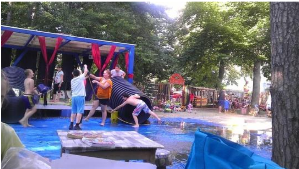
Oblivanje z vodo pred Ustvarjalnico

Zadnji teden v juniju je začela nastajati vodna pot, zato smo se v Ustvarjalnici lotili izdelovanja ladjic iz papirja. Te so kasneje otroci spuščali po tekoči vodni poti, kjer so se nekateri pogumnejši, tudi oblivali z vodo.