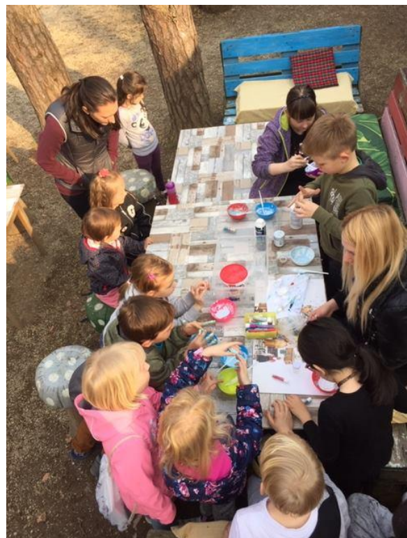
Ustvarjalnica v času izdelovanja sluzi

V Ustvarjalnici je bil dobrodošel prav vsak otrok, saj je namenjena otrokom vseh starosti. Najstniki pri svojem ustvarjanju načeloma niso potrebovali pomoči, medtem ko so mlajši otroci velikokrat prišli v spremstvu staršev in izdelovali svoje izdelke ob pomoči staršev. Nekateri otroci so si med seboj tudi pomagali in ustvarjali skupaj. Obiskovalcem so bile iz tedna v teden predstavljene različne ideje in alternativni viri, v kolikor so želeli izdelovati kaj po svojih lastnih željah. V Ustvarjalnici so se upoštevale potrebe otrok, njihove želje in kritike. Mlajši, povečini predšolski otroci, ki še niso tako spretni pri ustvarjanju, so imeli možnost risanja in barvanja pobarvank. Vsak izdelek, ki si ga je posamezni otrok izdelal, je kasneje lahko tudi odnesel domov. V primeru, da otrok ni uspel dokončal izdelka, ki ga je začel izdelovati, je lahko z njim nadaljeval naslednji dan.