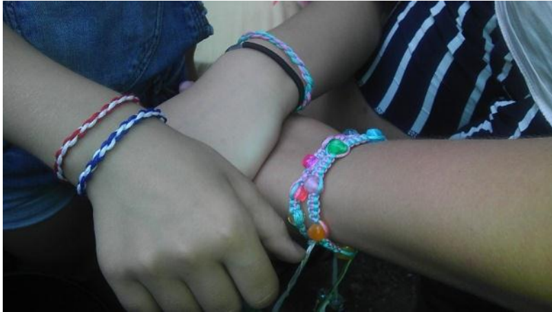
Otroci so pokazali zapestnice, ki so jih ustvarili.

Zadnji teden v juniju je začela nastajati vodna pot, zato smo se v Ustvarjalnici lotili izdelovanja ladjic iz papirja. Te so kasneje otroci spuščali po tekoči vodni poti, kjer so se nekateri pogumnejši, tudi oblivali z vodo.