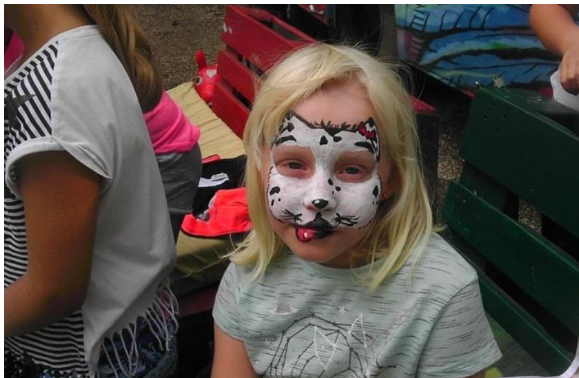
Neža je bila nagajiva muca

Naslednji teden smo iz gume, usnja in jeansa izdelovali natikače in copate, s katerimi se je marsikateri otrok pohvalil in z obutimi kar odkorakal naproti svojemu domu. Precejšen obisk, navkljub dežju, je bil v tednu, ko je v Ustvarjalnici potekala poslikava obraza in makeup. Nekateri otroci, predvsem tisti mlajši, so si zaželeli tudi poslikavo na roke. Starejši otroci so si delali sami med seboj makeup in barvali nohte v žive barve.