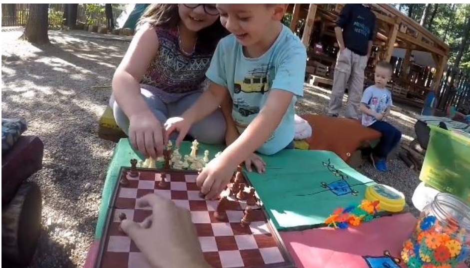
Prostovoljec Doğukan med šahovsko igro fotografira

25-letna Nazli je študirala novinarstvo in je med EVS projektom Youth in One želela predvsem izboljšati svoje znanje angleščine ter medijske kompetence. Na Doživljajskem igrišču je pripravljala program Ustvarjalnega kotička. Za pojasnjevanje napotkov pri ustvarjanju izdelkov se je naučila uporabljati telesno govorico, ob svojem izpopolnjevanju jezika je osnovnega sporazumevanja v angleškem jeziku naučila tudi otroke. Po zaključku projekta je ugotovila, da jo pri delu na televiziji, kjer si je želela poiskati zaposlitev, zanima priprava otroškega programa.