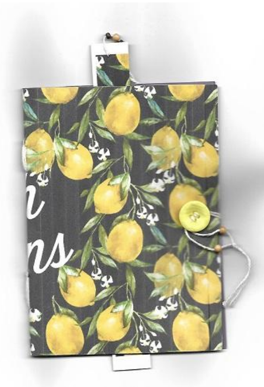
Prototip prostovoljke Nazli iz Ustvarjalnice za ročno vezavo knjig